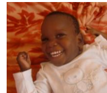
Swaumu (2) Zerebralparese Eltern verschwunden