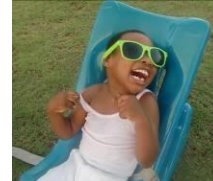
Consolatha (5) Zerebralparese Mutter gestorben Vater unbekannt