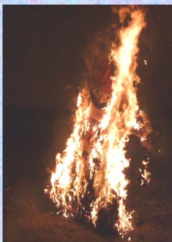
in der Nacht