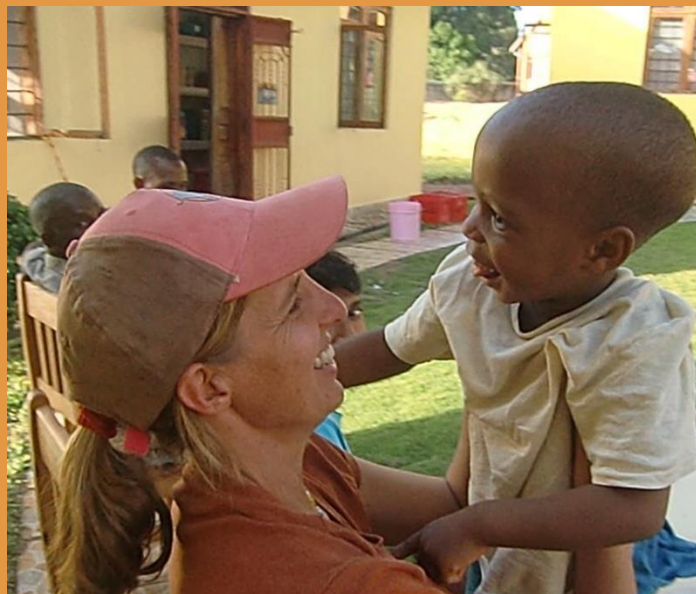
Freudige Begrüßung in Tansania

TOPICS: Wiedersehen in den Kinderdörfern Fortschritte in Tansania Entwicklungen in Namiba