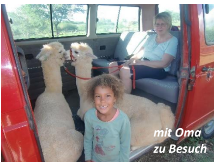
mit Oma zu Besuch

Einen ganzen Zoo habt ihr für unsere tiergestützte Therapiestätte gekauft! Mit meinem Aufruf zur Spendenkaufaktion 2020 haben neue kuschelige Tiere zu uns gefunden. Nach dem Motto: „Sitzbank raus – Alpakas rein“, haben Wuschel & Puschel die dreistündige Fahrt im Bulli gut überstanden und uns gezeigt, worin ihre Stärke liegt: Ruhe und Gelassenheit! Die beiden Esel Jenny & Jeronimo konnten hingegen in einem Trailer den Fahrtwind genießen. Als Bulli