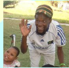
Gärtner und Fahrer Muba