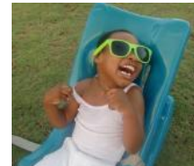
Consolatha (5) Zerebralparese Mutter gestorben Vater unbekannt