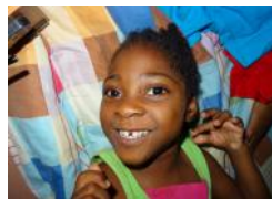
Neema (4) Mikrozephalus ausgesetzt